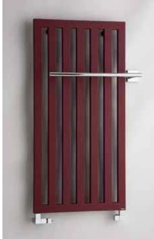
DARIUS DA1RE – provedení bordó (strukturální barva) 600 × 1200 mm s chromovým držákem PGH1