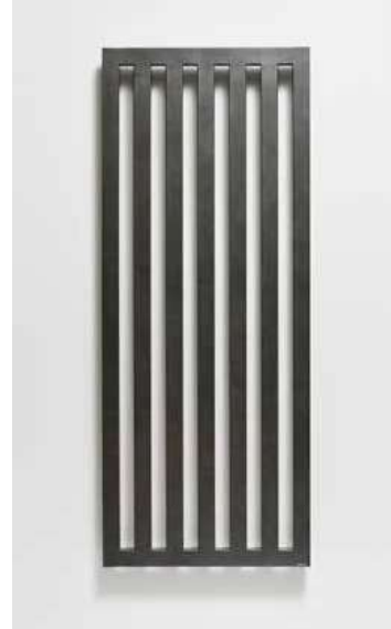
DARIUS DA2A – provedení antracit 600 × 1500 mm