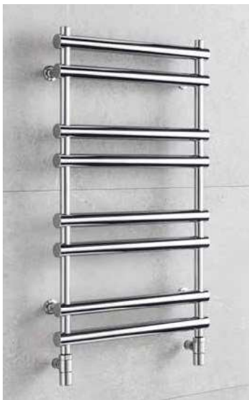
ULYSSES U4C – provedení chrom 500 × 838 mm