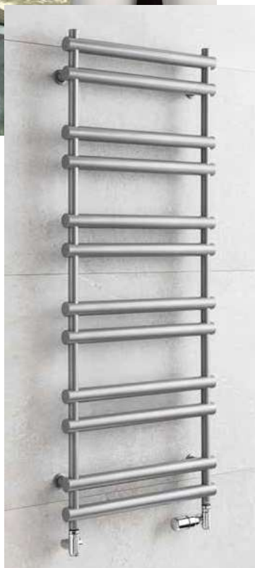
ULYSSES U7MS – provedení metalická stříbrná 500 × 1294 mm

Umístění „uchycení“ na stěnu: ↓ 115 mm ↑ 115 mm